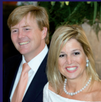
De Prins van Oranje en Prinses Máxima zijn het bescherm-paar van het Oranje Fonds.

Volg ons op Twitter, praat mee of stuur onze berichten door ('retweet') naar uw netwerk. Zo helpt u ons de kansen van het Oranje Fonds te verspreiden. Veel dank alvast! ■