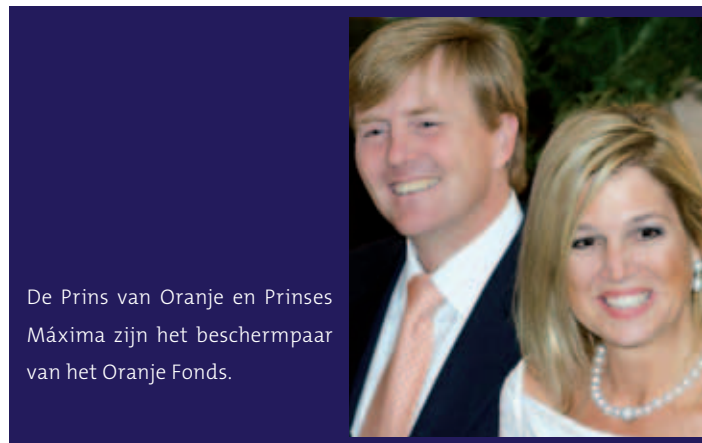
De Prins van Oranje en Prinses Máxima zijn het beschermbaar van het Oranje Fonds.