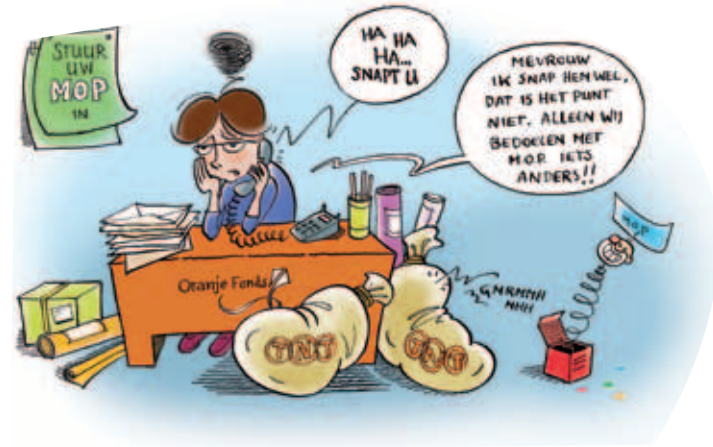
TEKENING: PETER VAN DORST

Om maatjesprojecten inhoudelijk een stap verder te helpen lanceerde het Oranje Fonds in 2009 de actie